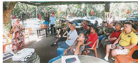
市议会举行汇报会以向逸福园的商民讲解社区整合计划的概念，希望借此在改善的环境卫生工作上获得商民的配合。