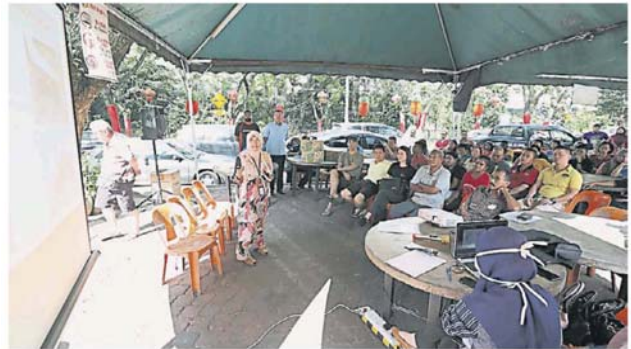
市议会召集商民讲解活化计划。