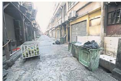
后巷卫生是活化计划的其中一环。

“我们希望通过今天的讲解和对话, 让业者明白市议会的计划, 也希望业者配合, 以在未来 3 至 6 个月完成活化计划。”