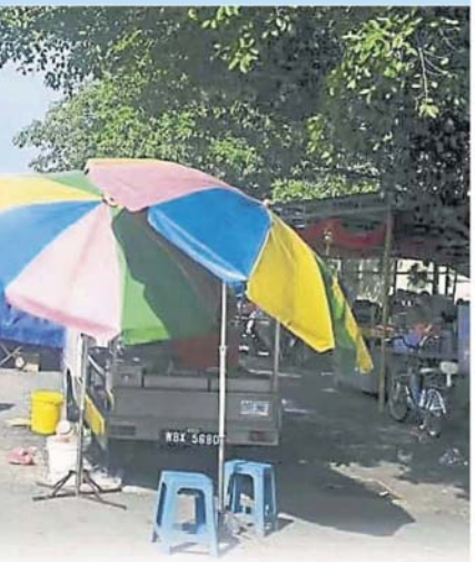
皇冠城早市小贩以新巴刹租金高及生意差为由，拒绝迁入新巴刹。

霸市与巴刹的距离太靠近，对小贩和小商造成极大冲击，建议重新规划把新巴刹改为小贩中心。