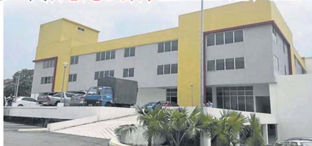
加影市议会将在农历新年后安排把早市小贩迁入新巴刹。

和市议员反映，要求继续原地摆卖，不过，对方指既然新巴刹已建成，小贩必须迁人，否则新巴刹将沦为白象计划。