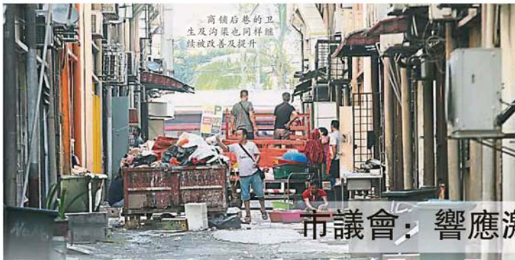
商舖后巷的卫生及沟渠也同样陆续被改善及提升

Provided for client's internal research purposes only. May not be further copied, distributed, sold or published in any form without the prior consent of the copyright owner.