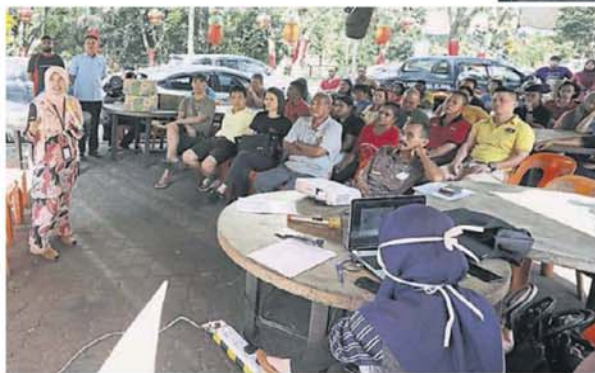
活化计划。市议会召集商家与居民, 讲解